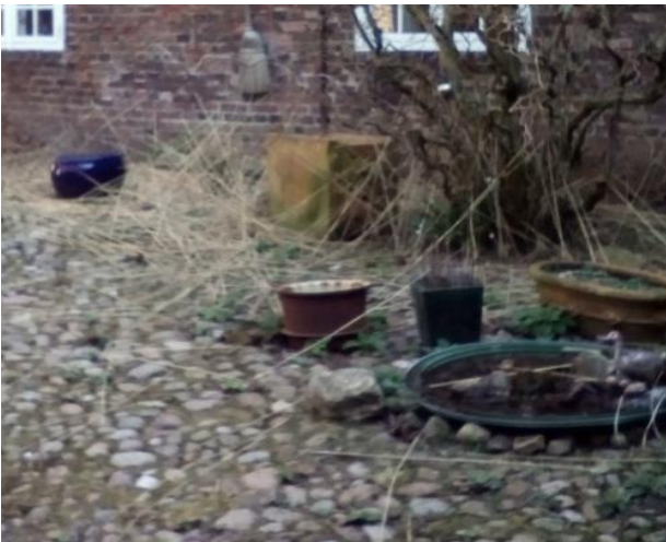
Innenhof von Laub und Reet befreien