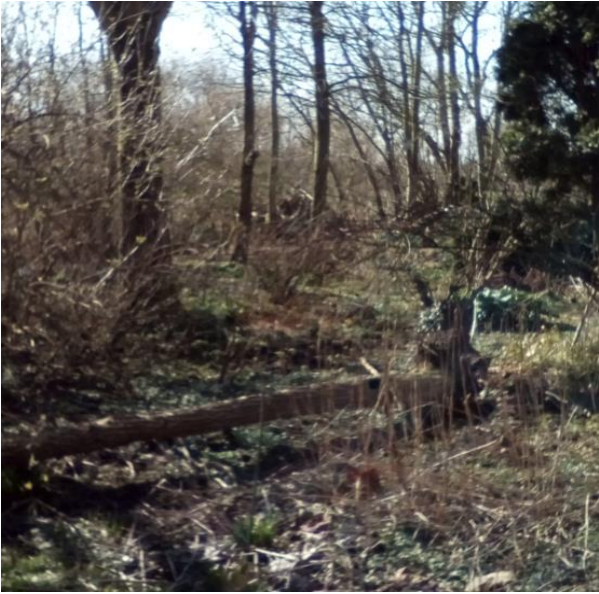
umgestürzte Bäume zerlegen und wegräumen