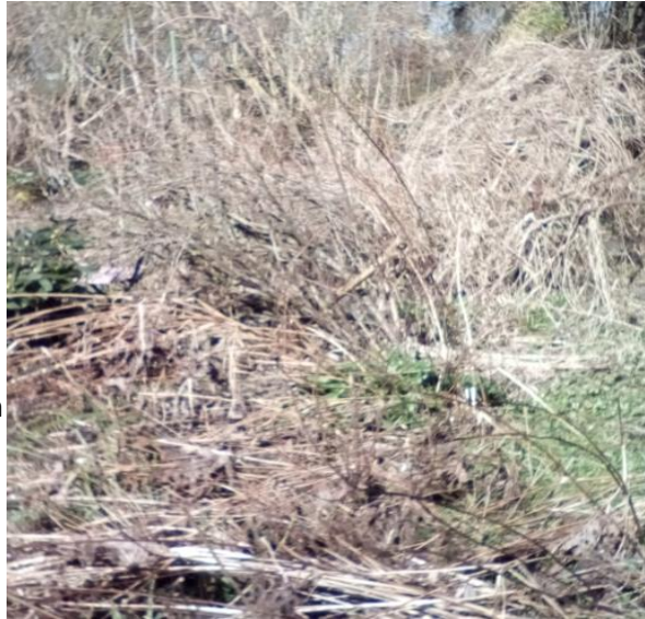
Abgestorbene Stauden säubern